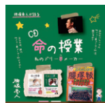
CD『命の授業』 ～私のドリー夢メーカー～