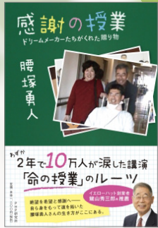
『感謝の授業』 PHP 研究所

活動開始から八年で全国、海外で、一五〇〇講演! 五〇万人の方に聴いていただくことが出来ました。