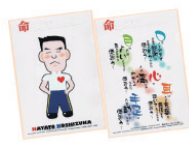
クリアファイル 2種 × 2枚 set