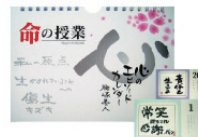
日めくりカレンダー 『心のエピソードカレンダー』