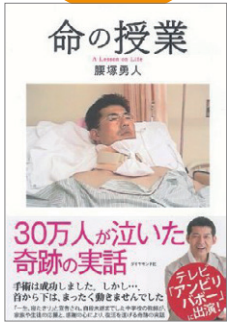
『命の授業』 ダイヤモンド社