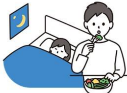
十分な休養と バランスのとれた食事