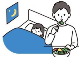
十分な休養と バランスのとれた食事