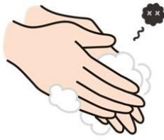
手洗い等の手指衛生