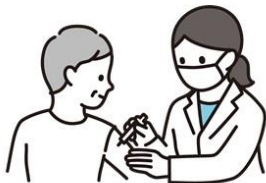
インフルエンザ ワクチンの接種