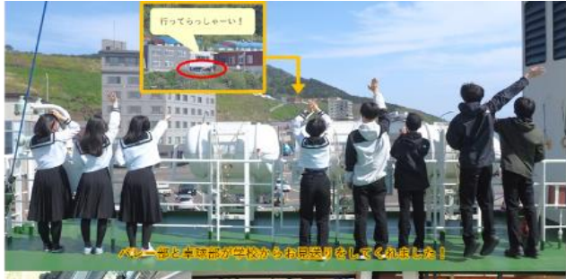
行ってらっしゃーい！ ベレー帽と卒業帽が学校からお土産をしてくれました！ 夕食後は全員プールへ！ウォータースライダーがとても楽しかったようです。あつという間の1日目でした。

2日目 は、丘珠空港から函館へ飛行機で移動。函館駅で観光大使活動。用意したグッズを配りながら礼文をアピール、時間内で全て配布しきりました。その後、各自昼食をとり、謎解きにグループごとにチャレンジ。夕食も各自で済ませ、夜景を見に出かけました。天気に恵まれ、とても綺麗な夜景を見ることができました。